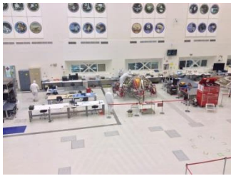
The clean room where they built the rover. Now working on the Rover 2020