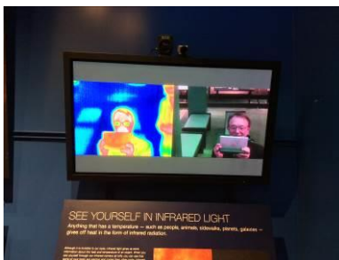
Mirror right, and in infrared camera left