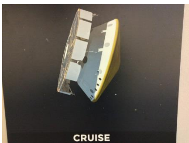
The spacecraft travelling towards Mars