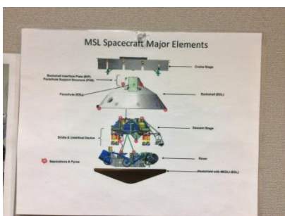
The scheme of the spacecraft