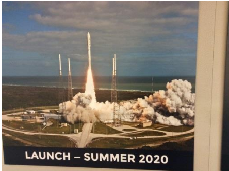
The launch schedule of the Rover 2020