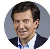
Gilles Péliçon PDG - TF1