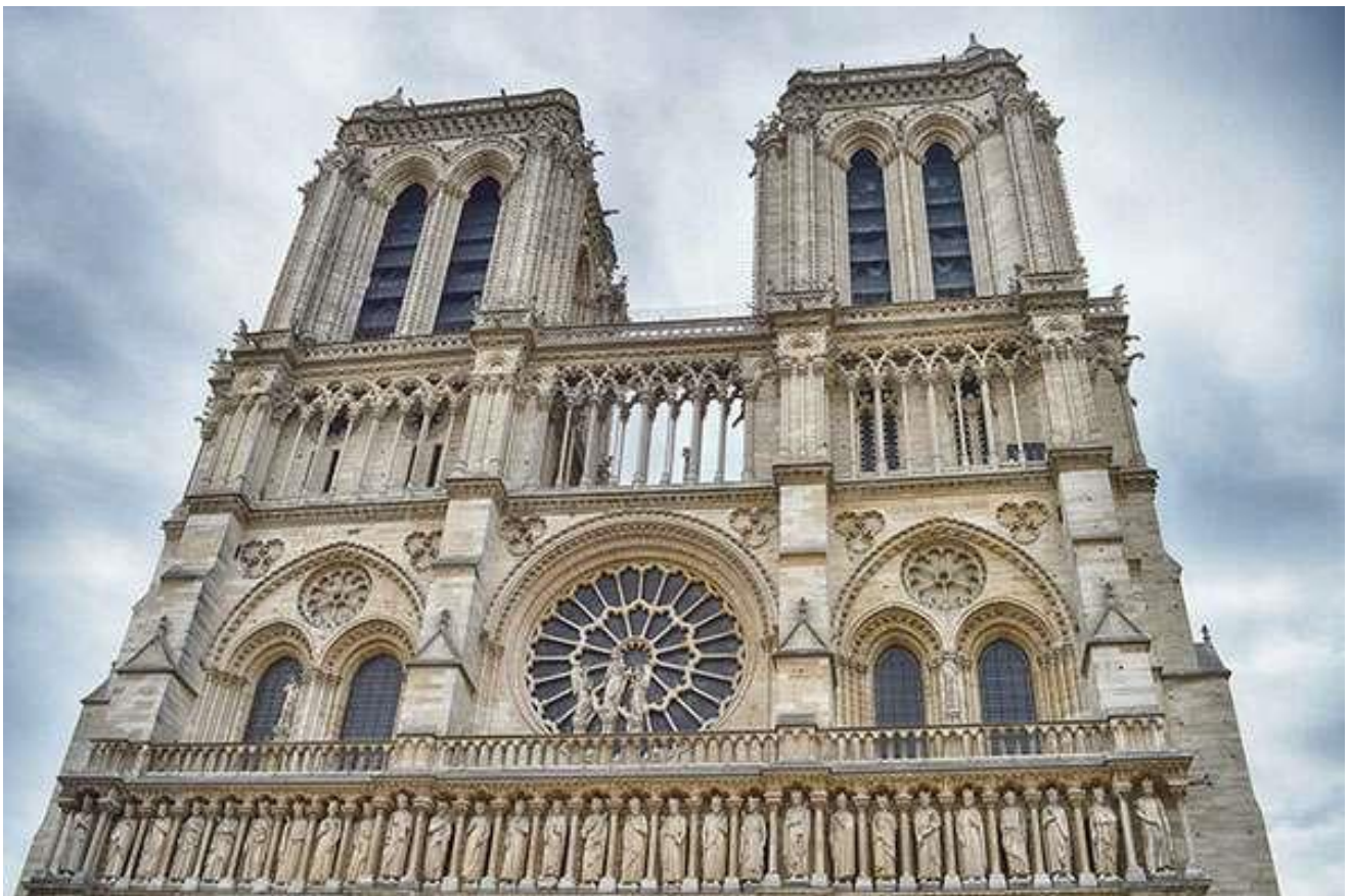
Vue sur les deux tours de Notre-Dame de Paris.

Quel rapport entre la quatrième dimension et Notre-Dame de Paris ?